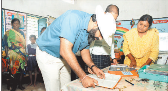
आकस्मिक निरीक्षण में स्कूल पहुंचे कलेक्टर रोहित व्यास।

सतीघाट की सड़क के लिए जलसंधारण विभाग को व्यवस्था बनाने कहा गया था। श्रद्धालुओं को परेशानी न हो इसके लिए जो भी संभव वैकल्पिक व्यवस्था हो करवाया जाएगा।