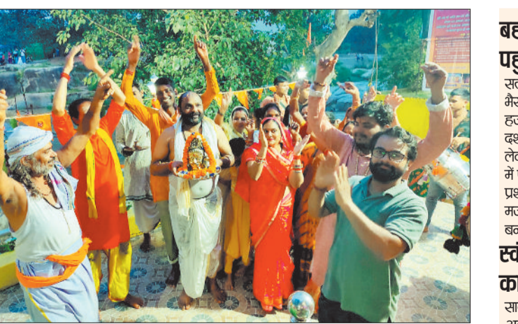
अंतिम सोमवार को झूमते नाचते श्रद्धालु।

कोतबा। धर्मनगरी कोतबा स्थित सतीघाट शिव मंदिर में सावन के अंतिम सोमवार को भक्ति और आस्था का अद्भुत संगम देखने को मिला। सुबह 4 बजे भक्त आरती के बाद से ही मंदिर परिसर में जलामिषेक करने शिव भक्तों की भारी भीड़ उमड़ने लगी थी। सुबह भगवान शिव की भस्म आरती के साथ धार्मिक कार्यक्रमों की शुरुआत हुई, जिसके बाद मंदिर के कपाट श्रद्धालुओं के लिए जलामिषेक हेतु खोल दिए गए। दराज गाँवों 8-10 किलोमीटर पैदल कांवर लाकर भक्तों ने भोलेनाथ को दिखाने में लगे रहे दिन भर हजारों भक्तों का जनसैलाव उमड़ पड़ा था।