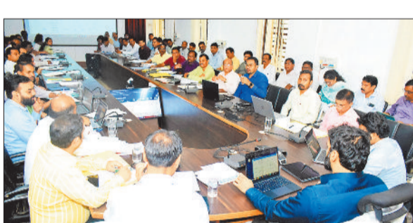
बैठक में भाग लेते बैंक अधिकारी।